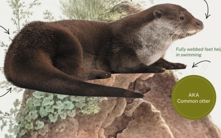
TEXT: NISARG PRAKASH, DESIGN: DIVYA MEHRA