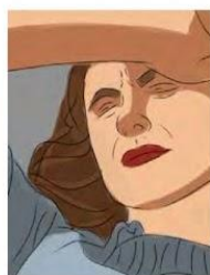
Sensitivity to light