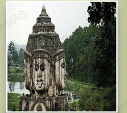
मध्य प्रदेश में अमरकंटक (जुलाई 2022)