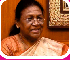
भारत की 15वीं राष्ट्रपति