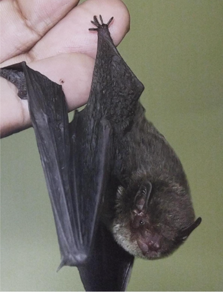
Glischropus meghalayanus , a species of bamboo dwelling bat from Meghalaya.