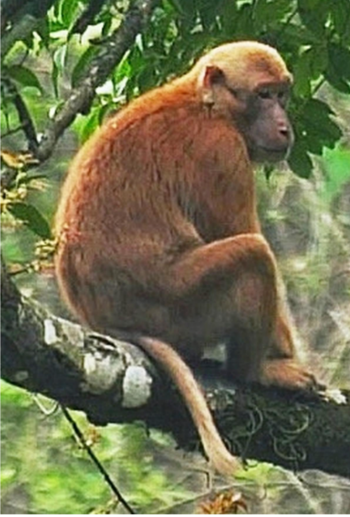
Sela macaque, a new species discovered in the western and central Arunachal Pradesh. | Photo Credit: Special Arrangement