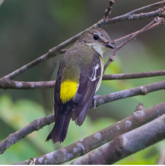
The yellow-rumped flycatcher was recorded in Narcondam Island of the Andaman archipelago.